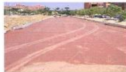
運動跑道防潮工程