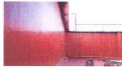
地下室外牆防水工程