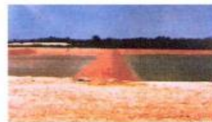
水池、養殖池防滲工程