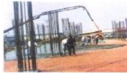
地坪防潮、防水工程