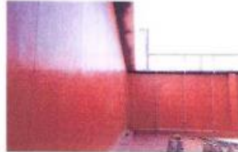
地下室外牆防水工程