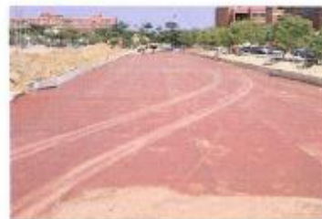
運動跑道防潮工程