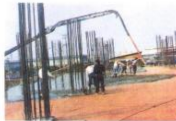
地坪防潮、防水工程