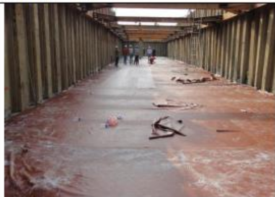
光和材料廠水箱地坪