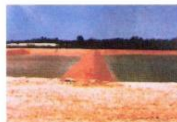
水池、養殖池防滲工程